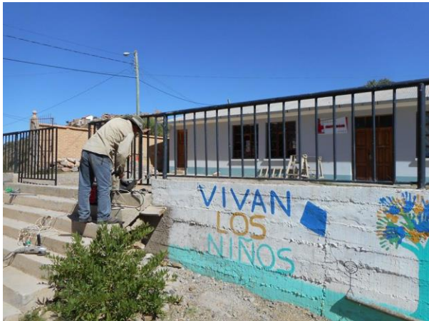
Het nieuwe hek bij het kinderdagverblijf Ciruelitos

Daarnaast helpt Amigos ook met de vergoedingen van het personeel tijdens de overbruggingsperiode januari, februari en maart. In deze drie maanden worden er vanuit het gemeentelijk project namelijk geen vergoedingen toegekend. Het gemeentelijk project Pan financiert namelijk maar 9 maanden per jaar en de overige maanden vangt Stichting Amigos op, waardoor de kinderen toch het hele jaar kunnen worden opgevangen in het kinderdagverblijf. Tot slot heeft Amigos geholpen met educatieve materialen voor de kinderen en een nieuw hek.