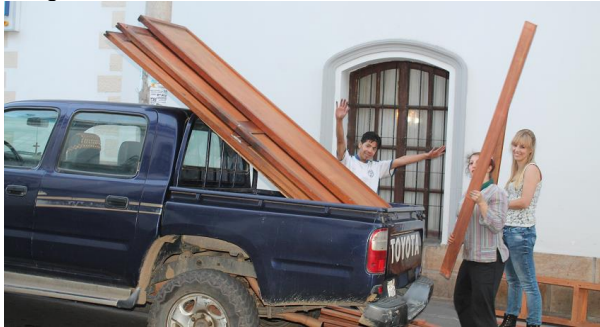
De grote voorraadkast wordt geschonken aan het weeshuis