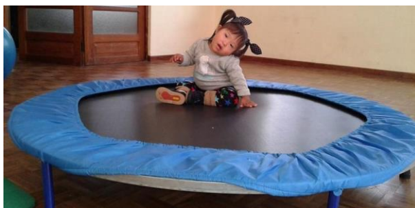
De trampoline wordt ook door de allerkleinste gebruikt!