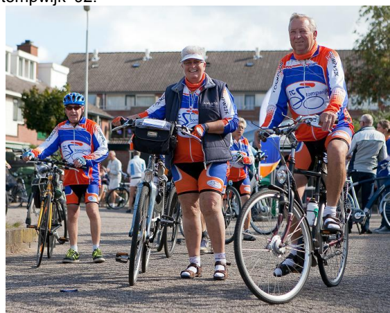
Fietsen voor het goede doel met de Rabosponsorfietsstocht

Voor Stichting Amigos hebben de fietsers van de Rabobank sponsorfietsstocht op zondag 21 september 2014 € 279,50 bij elkaar getrap. Een prachtige route en goed fietsweer hebben vele mensen op de fiets gekregen om voor een goed doel euro's bij elkaar te trappen. Men kon kiezen uit een route van 20, 40 of 60 kilometer. Jaarlijks is het een mooi sportief evenement met traktaties van koffie, limonade, poffertjes en muziek. Vanwege de fusie van de Rabobanken Rijnstreek en het Groene Hart Noord is voor 2015 de datum vervroegd. De Rabobank sponsorfietsstocht wordt nu zondag 28 juni 2015 verreden. Wij bedanken alle fietsers die Stichting Amigos als goede doel hebben gekozen en wij rekenen 28 juni weer op u. Ons doelnummer is 223 en in Stompwijk is de start om 09.00 uur bij Sportvereniging Stompwijk '92.