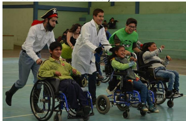
Wie wint? Blijde kinderen van het Psicopedagogico!

In de vakantieperiode hebben de kinderen met de steun van Amigos een mooi vakantieprogramma gekregen met veel activiteiten en leuke uitjes.